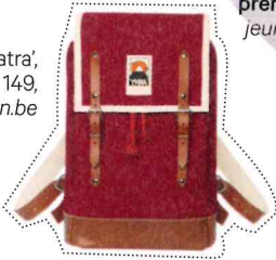
Rugzak 'Matra', YKRA , € 149, rewinddesign.be