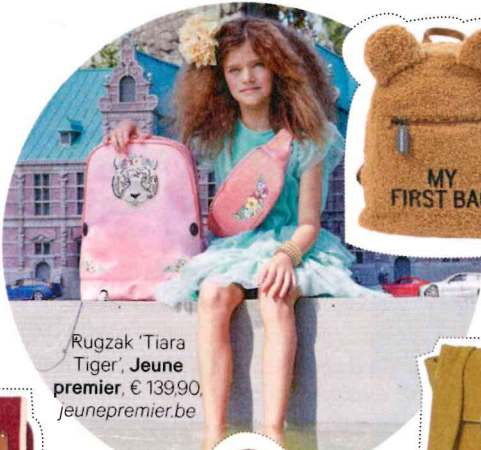
Rugzak 'Tiara Tiger', Jeune premier , € 139,90, jeunepremier.be