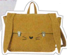
Kleuterboekentas 'Lapin', Emile et Ida , € 70, smallable.com