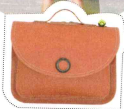
Boekentas, Own Stuff , € 179, lenaerts.be