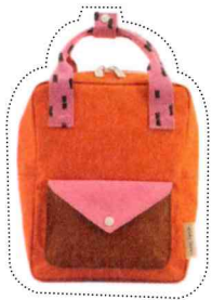
Kleuterrugzak, Sticky Lemon , € 44,95, stickylemon.nl

Met de eerste schooldag in zicht is de jacht op de leukste boekentas geopend. Roeland Motmans, de voorzitter van de Vlaamse Ergonomie Vereniging geeft zijn beste tips.