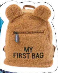
Kleuterrugzak 'My First Bag', Childhome , € 39, childhome.com